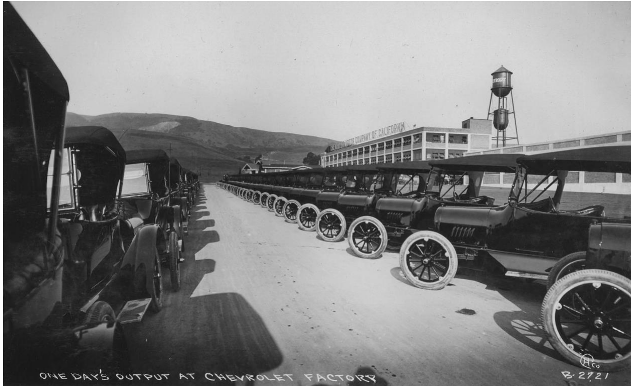
(시보레 조립 공장, 캘리포니아 오클랜드, 1917 년경)

2 차 세계 대전 이후, 대규모 제조 시설이 문을 닫거나 이전하면서 오클랜드의 엘름허스트 동네는 변화하기 시작했습니다. 이 동네의 인구 구성은 주로 백인에서 시간이 지나면서 주로 흑인으로 바뀌기 시작했습니다. HPC 의 회중도 이러한 변화를 반영했습니다. ( Litherland, Rev. RH; "최종 보고서 - 임시 목회; 힐사이드 장로교회; 1992 년 1 월 - 1992 년 9 월" )